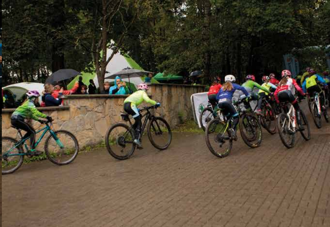
Detská tour Petra Sagana / Pētera Sagāna bērnu brauciens