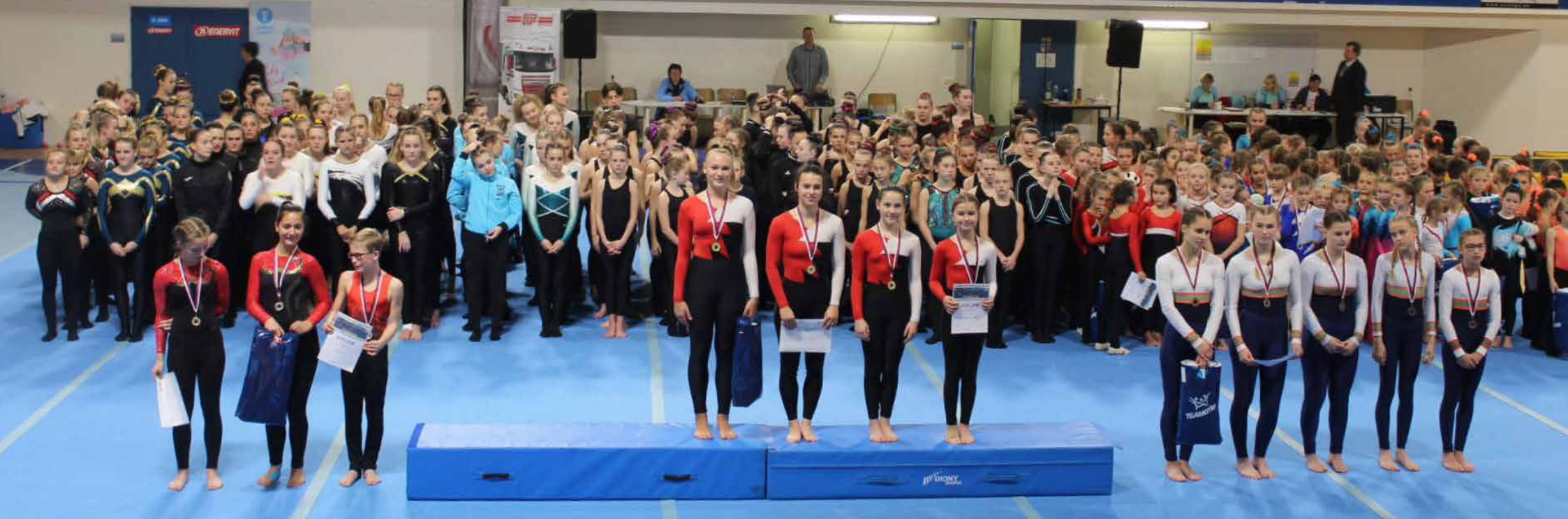
Republiková soutěž ČASPV v TeamGymu / Nacionālais čempionāts komandu vingrošanā