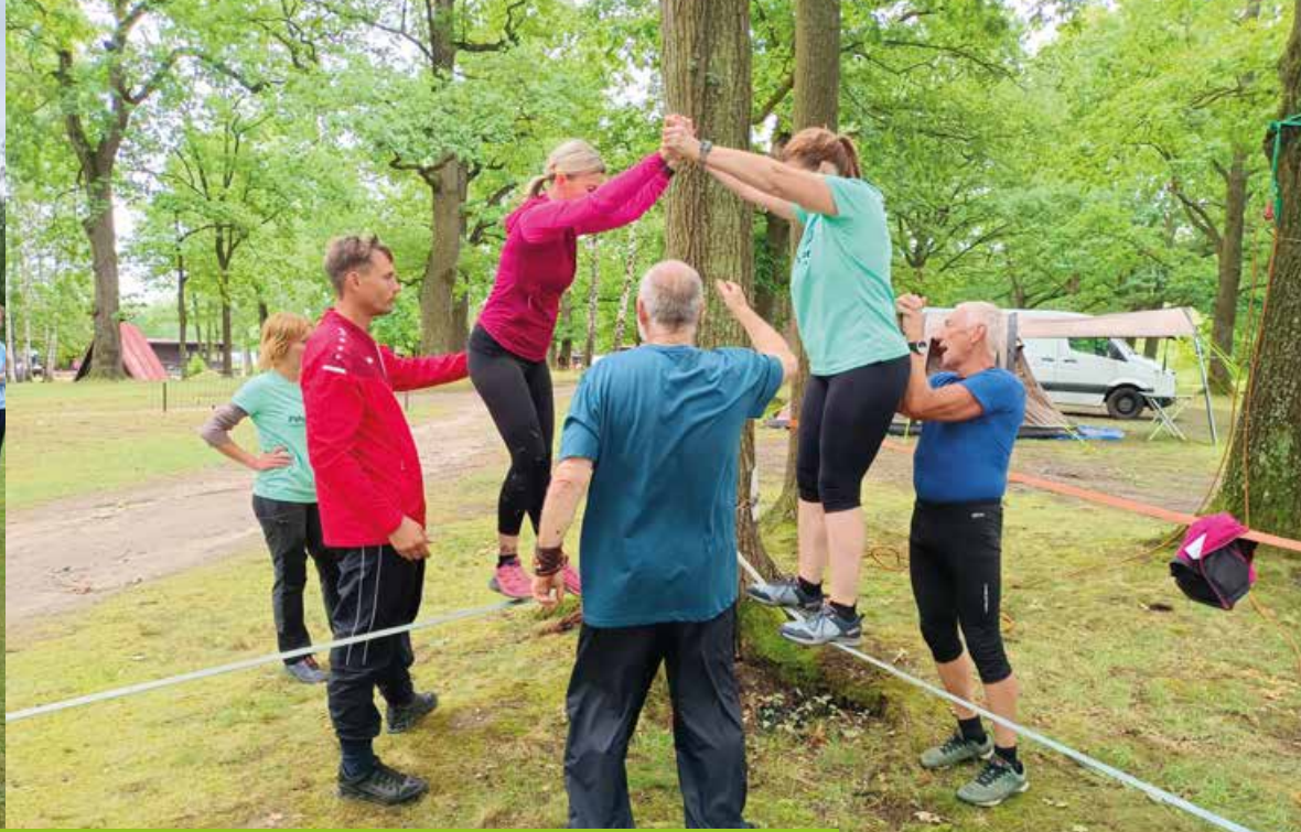
Letní slavnosti dospělých / Vasaras sporta festivāls pieaugušajiem