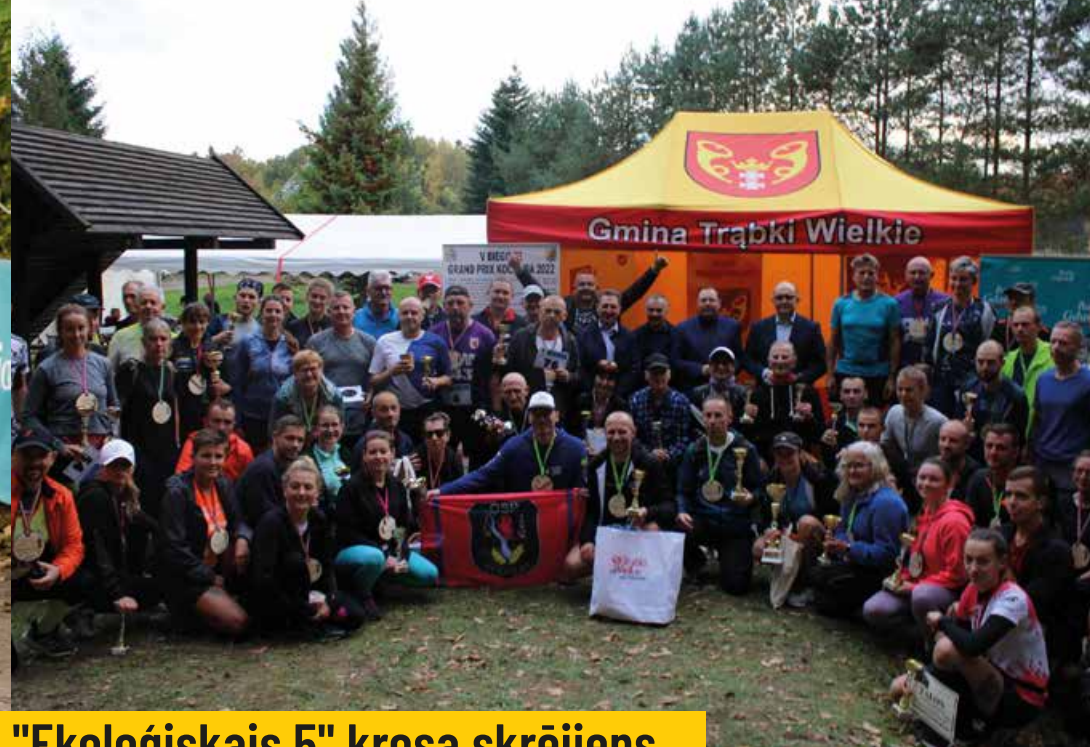
Bieg przełajowy "Ekologiczna 5-tka" / "Ekoloģiskais 5" krosa skrējiens