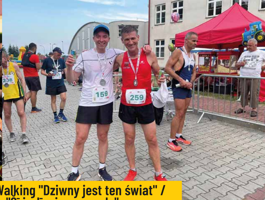
8 Bieg Czterolistnej Koniczynki i Nordic Walking "Dziwny jest ten świat" / 8. Cetrlapu āboliņa skrējiens un nūjošana "Sī ir divaina pasaule"